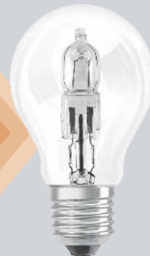
ŻARÓWKA ECO CLASSIC