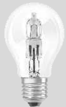
ŻARÓWKA ECO CLASSIC A E27 18, 28, 42, 52, 70, 105W